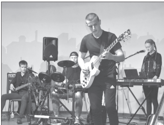
На сцене - музыканты студии «Свобода»

В городском саду «Текстильщик» прошел концерт-акция, посвященный памяти лидера группы «Кино» Виктора Цоя.