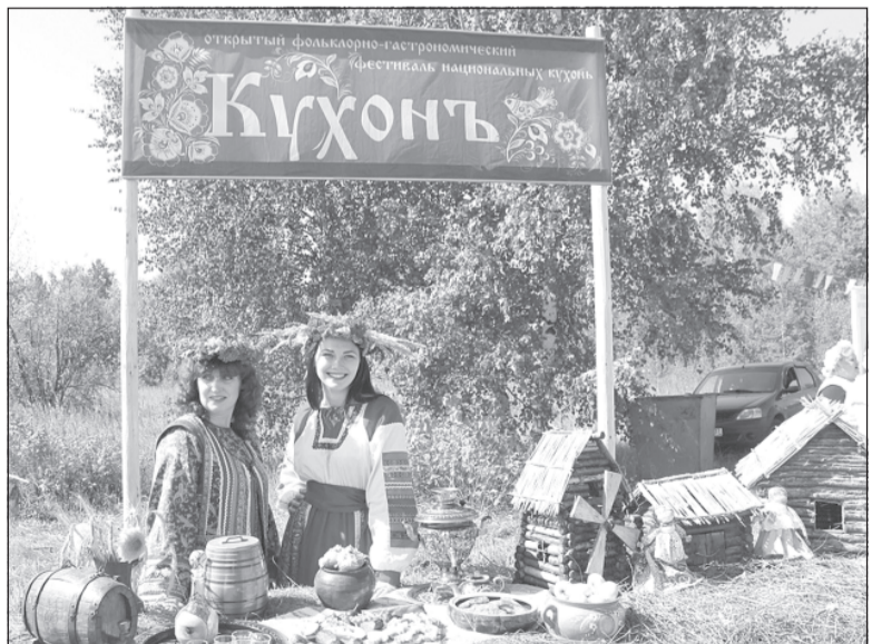
С каждым годом гостей и участников Международного фольклорно-гастрономического фестиваля национальных кухонь становится больше.

Представительницы бизнес-сообщества также рассказали губернатору о новых проектах. В свою очередь глава региона рассказал о планах по развитию транспортной инфраструктуры, «перезагрузке» знаковых промышленных и культурных объектов, решению кадровых вопросов. Станислав Воскресенский также подчеркнул, что с вниманием относится ко всем инициативам предпринимательского сообщества.