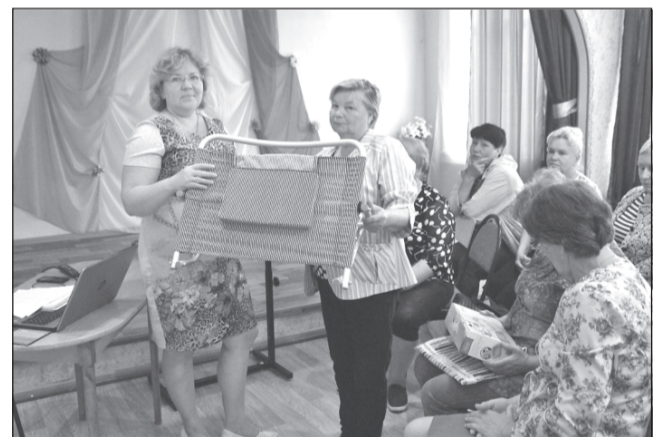
Занятие по использованию средств по реабилитации

Начались работы по ремонту неиспользованного помещения ЦСО для город-