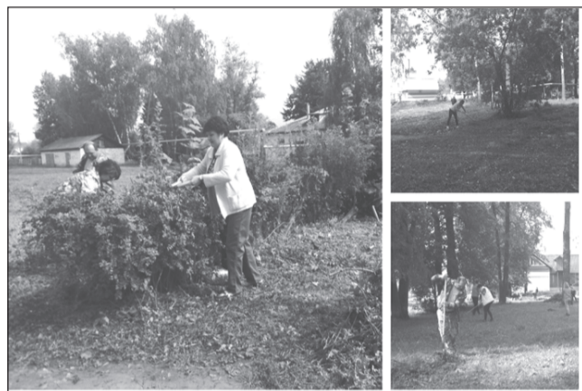
На новой спортплощадке всё должно быть на высоком уровне

В прошлую пятницу состоялся субботник по уборке общественной территории СЮТ.