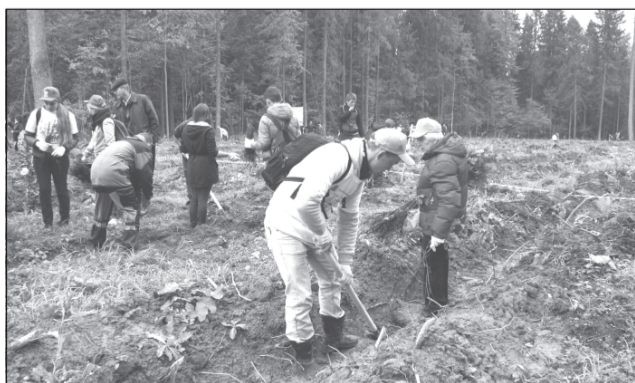
Пройдут годы и здесь вырастет сосновый бор

Всероссийская акция «Живи, лес!», организованная восемь лет назад Федеральным агентством лесного хозяйства, проводится с целью привлечения внимания к проблемам восстановления и приумножения лесных богатств РФ. Ежегодно акция проводится в период с 1 сентября по 31 октября.