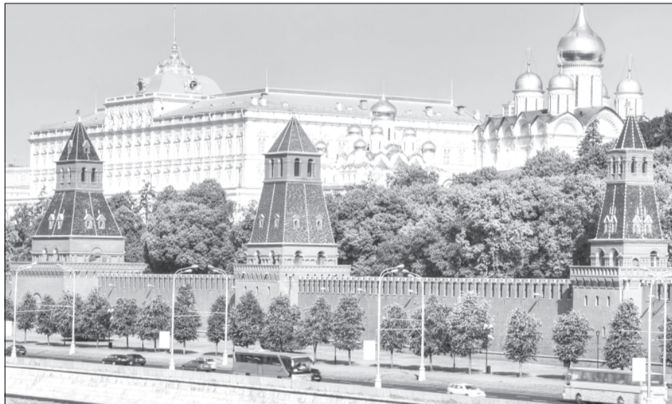
Станислав Воскресенский вошел в состав совета при Президенте России по развитию местного самоуправления

Этим же указом утверждены обновленный состав президиума Совета при президенте РФ по развитию местного самоуправления. Председатель президиума – Премьер-министр России Дмитрий Медведев.