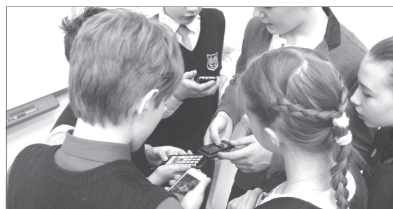
Сдать до востребования!

Анализ международного опыта использования мобильных телефонов школьниками выявил, что длительное время их использования, а также использование во время пребывания в школе могут привести к нарушениям психики, гиперактивности, раздражительности, нарушениям сна, а также снижению умственной работоспособности, ослаблению памяти и внимания.