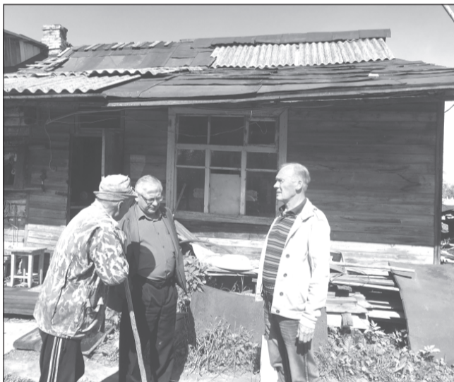
Сочувствие и внимание к нуждам земляков стало нормой жизни для людей, наделенных властью

В рамках проекта «Скорая социальная помощь» были выделены средства на замену кровли дома ветерана боевых действий.