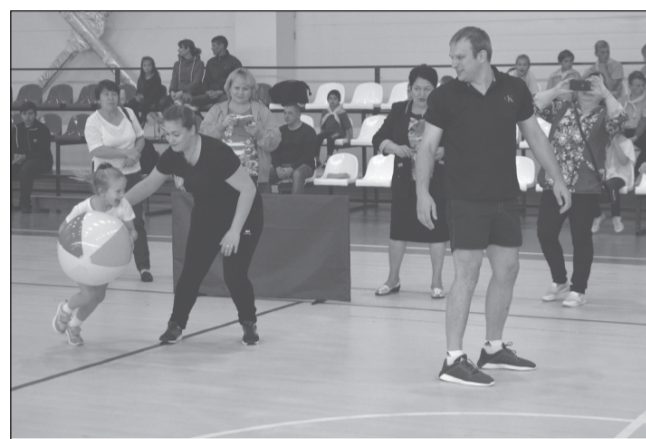
Без мам - никуда