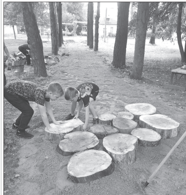
Ребята хорошо потрудились - выровняли грунт и начали укладку древесных спилов

Также вы можете оформить подписку и непосредственно в редакции газеты. Стоимость её на 1 месяц составит 57,50 руб., на 4 месяца - 230 руб. Ждем наших постоянных подписчиков, а также всех, кто хочет быть в курсе районных новостей.