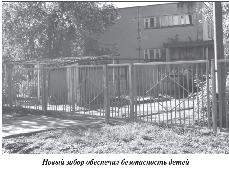
Новый забор обеспечил безопасность детей

Также планируется сооружение навеса для колясок. Это стало возможным благодаря установке нового забора. Раньше, когда доступ на территорию сада был проще, мы не могли быть уверены, что на оставленные коляски не позарятся посторонние лица.