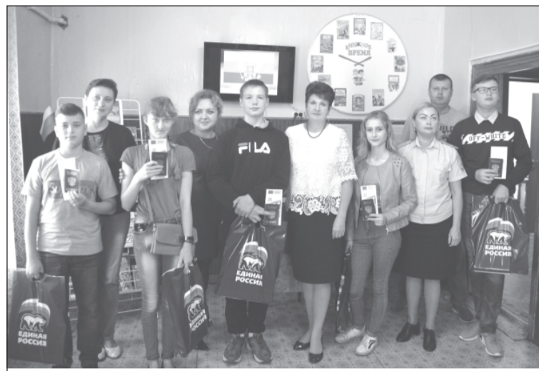
Участники торжественной церемонии